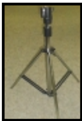
Stativ (Nr. M 008 U) Tripod (code M 008 U)