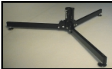
Bodenstativ (Nr. M 297 F Base) Base Tripod (code M 297 F Base)